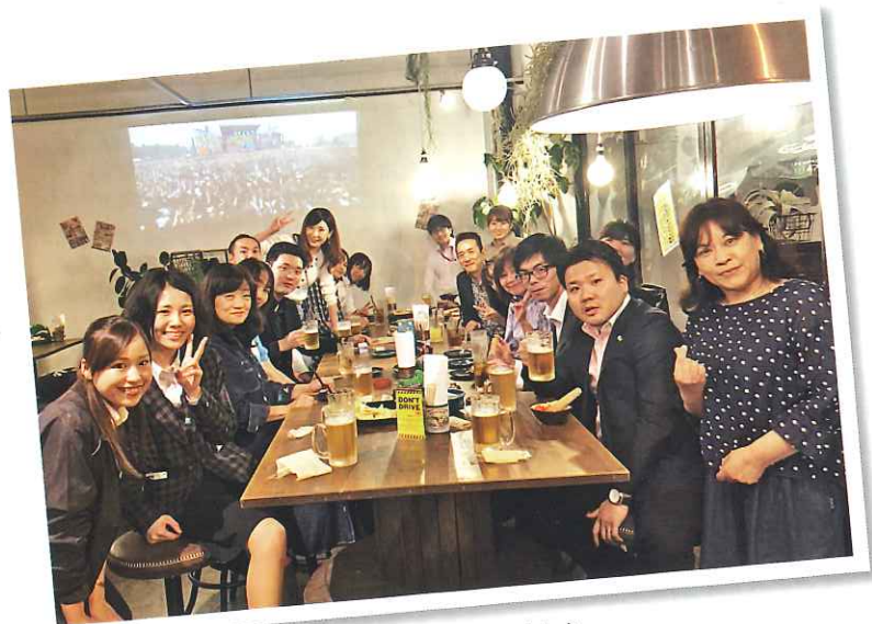
↑ 新入社員歓迎会の様子。皆で盛り上がりました