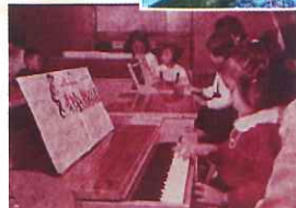
教室開設当時のレッスン風景