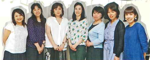
コンサートプロジェクトメンバーの講師陣

日時 / 2019年8月10日(土) 2回公演 (1回目)【開場】10:30【開演】11:00 (2回目)【開場】15:30【開演】16:00