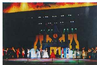
みゅーじっくらんど'91の様子