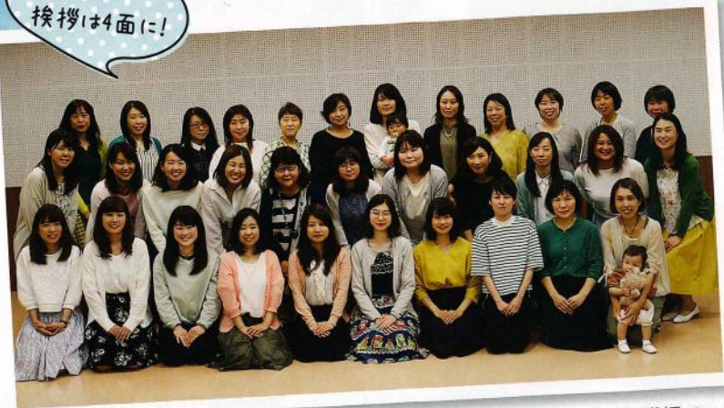
マツイシ楽器店 ヤマハ音楽教室・ヤマハ英語教室・ピアノ教室 講師