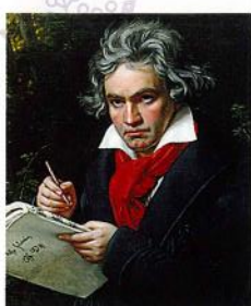
半田ミュージックセンター

【日時】12月24日(土)/25日(日) 開場9:30 開演11:00 終演21:00(予定) 【会場】ポートメッセなごや1~3号館 【料金】1日券7,560円/2日通し券14,040円 一般発売中 ※詳しくは公式ホームページまで