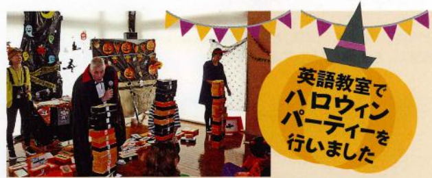
英語教室でハロウィンパーティーを行いました

10月23日、英語教室のみなさんを対象に、ハロウィンパーティーを開催しました。ネイティブゲストからハロウィンで使える英語を教えてもらい、ボックスビルディングゲーム、クラフト、トリックオアトリーティングを楽しみました。自分で作ったキャンディバッグを持ってのトリックオアトリーティングは特に大盛り上がり!「お菓子をくれなきゃイタズラしちゃうぞ!!」英語でなんて言ったかな...?ぜひ覚えておいてね。