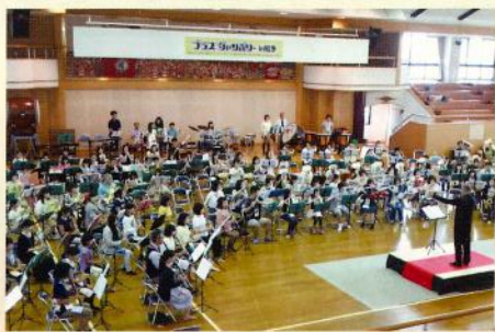
ブラスジャンボリーの大合奏の様子

知多半島地区で初開催した「ブラスジャンボリー」。今後、恒例化し、より多くの人達に楽しんでいただけるイベントにしたいと思います。ご期待下さい。