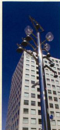
当社が設置した、栄の中日ビル交差点にあるカリヨン

この目標に向けて、今年も大小たくさんのイベントやコンサートを行いました。春の音楽祭や9月に初開催した「ブラスジャンボリーin知多」、新オープンした「赤レンガ建物」でのコンサート、名古屋市栄にある「カリヨン」メロディの復活などがあります。また、今年は「自分自身も音楽を楽しみたい」と思い、ピアノのレッスンを始めました!私自身も音楽を通じて毎日を笑顔で過ごしていきたいと思っております♪