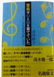
音楽は心と脳を育てていた ヤマハ音楽教室の謎に迫る (吉井妙子 日経BP社 1,404円)

学校行事でも度々伴奏する機会に恵まれましたが、「もはや「伴奏」ではない!皆の歌声とまいさんのピアノのコラボだ!」と、最高のお言葉をもらいました。それはまさにヤマハで培ってきた力そのものだと思います。