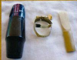
左から、マウスピース・リガチャー・リード

サックスの音を鳴らすのに必要な、マウスピース・リガチャー・リード。ご自身のをお持ちであれば、持ってきて試奏されると、より楽器との相性が分かると思います。もちろん、こちらで用意もございますので、手ぶらでのご来店もOKです!