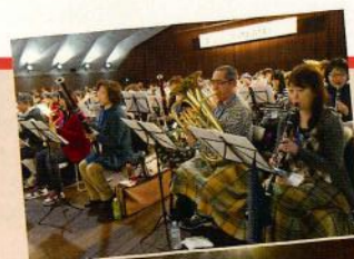
昨年、横浜で開催されたプラスジャンボリー

プラス・ジャンボリーは管楽器を愛するたくさんの方たちに大合奏を楽しんでいただくための演奏会です。管楽器・打楽器の愛好者であれば初心者、ファミリー、吹奏楽部員の方など、どなたでも参加できます。プロの指揮者や演奏家とともに、大合奏を楽しみながら音楽の深まりや感動を創り上げに、この秋、参加してみませんか。