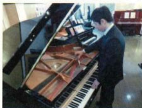
当店調律師による調律風景

また、物語の中で色々なピアノが出てきますが、若干名前を変えてあるものもあります。「アマギ」というピアノはおそらく「ヤ〇ハ」です(笑)。そしてこのアマギの調律師さんが登場するのですが、