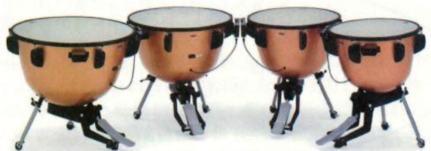
ヤマハ ペダルティンパニ(3100シリーズ)

ティンパニは「音程の作れる太鼓」。丸い金属の底のおかげで、中に閉じ込められた空気がドラムのような複雑な振動をしないため、規律正しい膜振動が得られるのです。