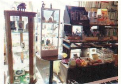
見るだけでも楽しい雑貨コーナー

リュージュ クリスマスベルオルゴール 2006年製 (29,400円→特価 14,700円) スイス リュージュ社製。絵・色・曲を変え、クリスマスに向けて限定発売されています。特別限定価格で。