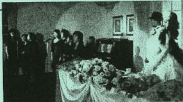
↑同じクラス生の結婚式で歌声を披露