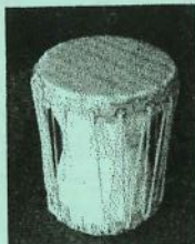
↑こんな太鼓が 作れるよ