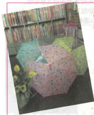
音符柄 傘 525 円(40cm 幼児用)

体験レッスン…レッスンの一部を実際に体験できます 見学レッスン…現在レッスン中のクラスを見学できます 教室総合受付 0120-37-5576 ミュージックガーデン大府 0120-0214-25 ミュージックガーデン武豊 0569-84-1579 まずはお近くの教室に、気軽にお問合せください。