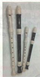
リコーダー ヤマハ ソプラノリコーダー YRS-27Ⅲ/1260 円 YRS-37Ⅲ /1680 円 ヤマハ アルトリコーダー YRA-28BⅢ/2310 円 YRA-38B Ⅲ/2730 円

傘のほかに、ト音記号の消しゴムや音楽柄のなまえペン、定規、赤鉛筆など文房具も取り揃えています。新しい生活に向けて、お気に入りの商品を見つけにご来店くださいませ。