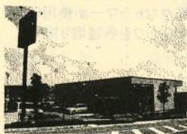
ミュージックガーデン大府

音楽教室ミュージックガーデン大府、管楽器・LM楽器専門店サウンドメイトマツイなどをオープンし、音楽に親しみ、真の豊かさを求める方々にお応えできる会社へと変化を遂げて参りました。いつの時代も次代に先駆ける会社でありたいと願っています。