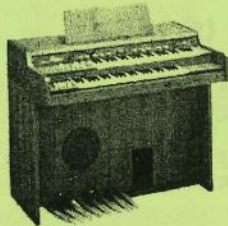
ヤマハエレクトーン1号機

また、ヤマハエレクトーンが発売されたのもこの頃、ヤマハが当時の最先端技術を導入して発売したエレクトーンは新しい時代の幕開けを感じさせました。弊社にはその1号機も保管してあります。